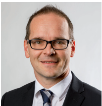
Grant Hendrik Tonne Niedersächsischer Kultusminister

Auf dieser Grundlage werden Sie eine fundierte Entscheidung für den weiteren Bildungsweg Ihres Kindes treffen können. Ein glückliches Kind, das den Anforderungen der gewählten Schulform motiviert begegnet, sollte das gemeinsame Ziel sein.